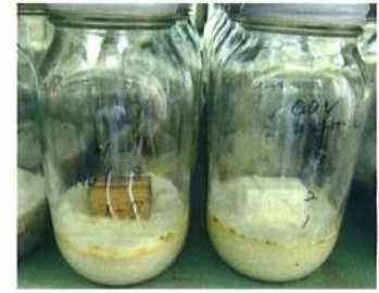
防腐試験 (京大大学生存圏研究所)